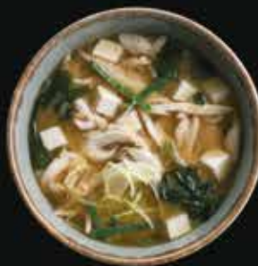
Мисо-суп Miso soup

Мисо-бульон, тофу, вешенки, водоросли вакамэ, лук-порей.