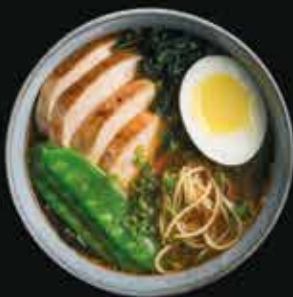
Рамен с курицей Ramen with chicken

Яичная лапша, рамен-мисо бульон, куриная грудка, водоросли вакамэ, куриное яйцо, зеленый горошек, зеленый лук.