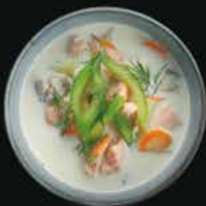
Уха по-Скандинавски Scandinavian fish soup

Рыбный бульон, лосось, треска, картофель, сельдерей, морковь, лук-порей, сливки.