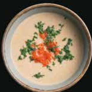
Крем-суп из лосося Salmon cream soup

Лосось, рыбный бульон, сливки, икра масаго, укроп.