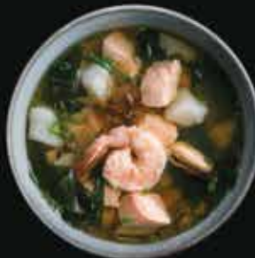
Суп с морепродуктами Soup with seafood

Рыбный бульон, лосось, треска, тигровая креветка, мидии, водоросли вакамэ, лук-порей, зеленый лук.