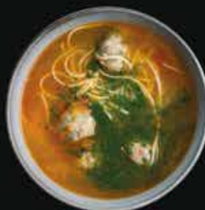
Куриный суп-лапша Chicken noodle soup

Куриный бульон, яичная лапша, куриные фрикадельки, зелень, лимон.