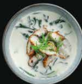
Сливочный суп с угрем Creamy soup with eel

Рыбный бульон, угорь, сливки, лук-порей, рис, вакамэ