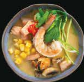
Том Кха Tom Kha

Лосось, мидии, креветка, кукуруза, бульон Том Кха, шампиньоны, имбирь, лук-порей, зелень, чили.