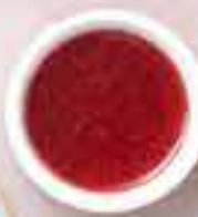
Панкейки Pancakes 120,–