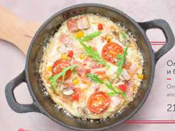
Омлет с овощами и беконом Omelet with vegetables and bacon 210,–