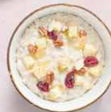
Овсяная каша с яблоком и корицей / Овсяная каша классическая Oatmeal porridge with apple and cinnamon / Oatmeal porridge 160,– / 80,–