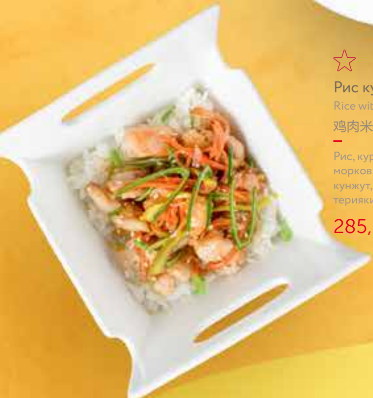
Рис / Rice / 米饭 155,-