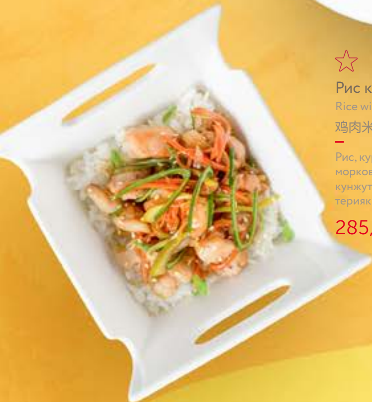
Рис / Rice / 米饭 155,-